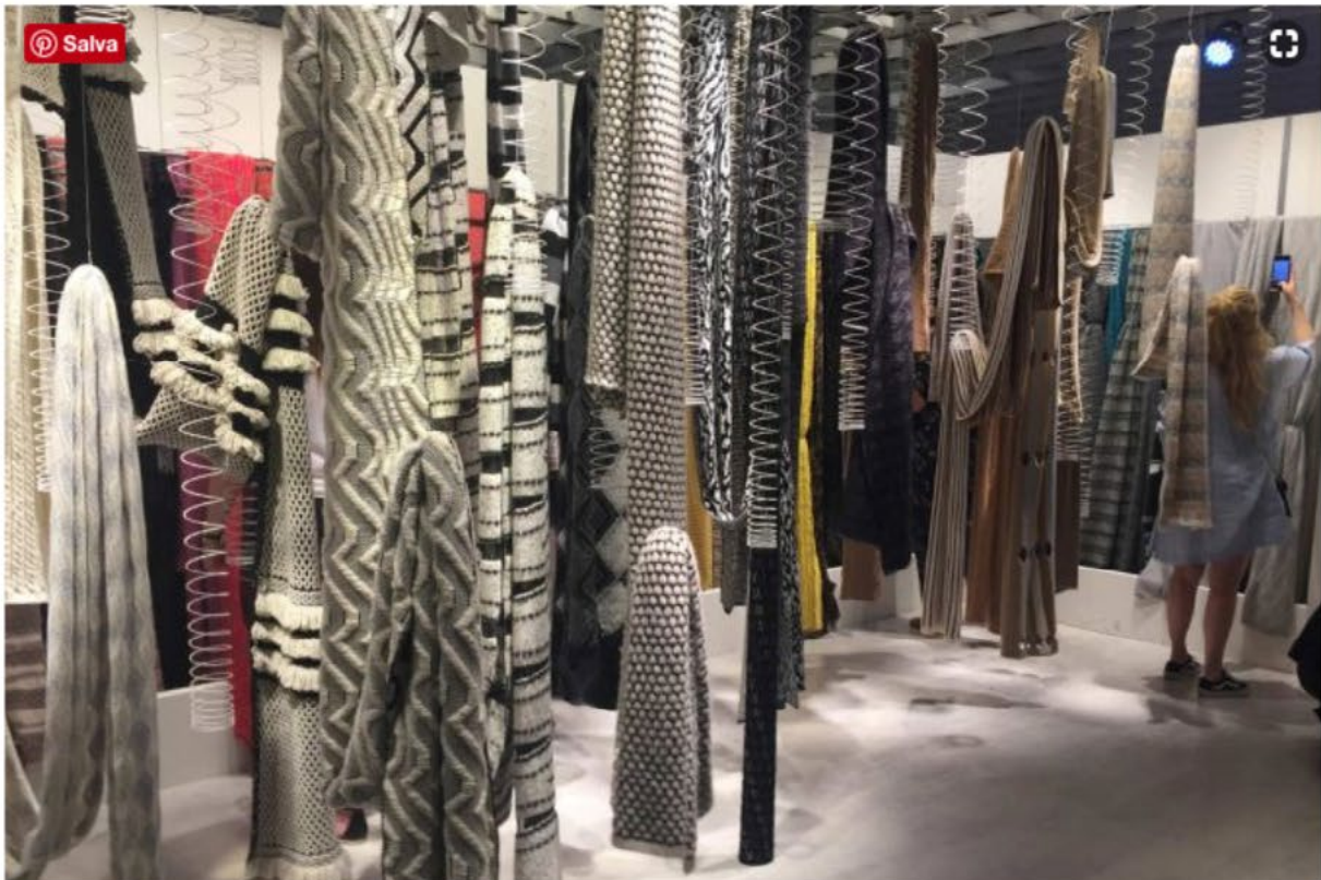
Italiens Stoffmessen sind führend in der Welt.