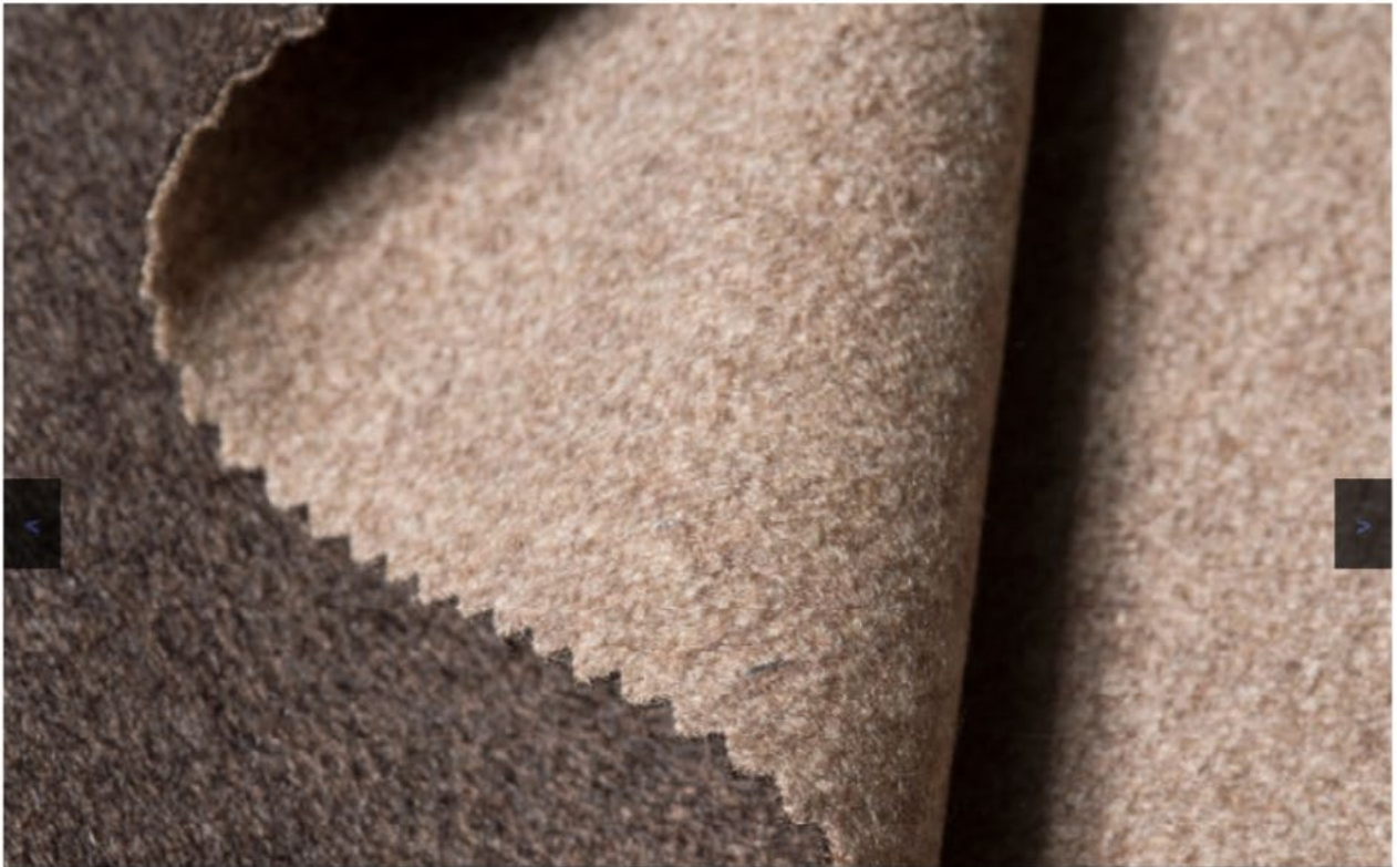
Elastischer Kaschmir (Bild: Botto Giuseppe)