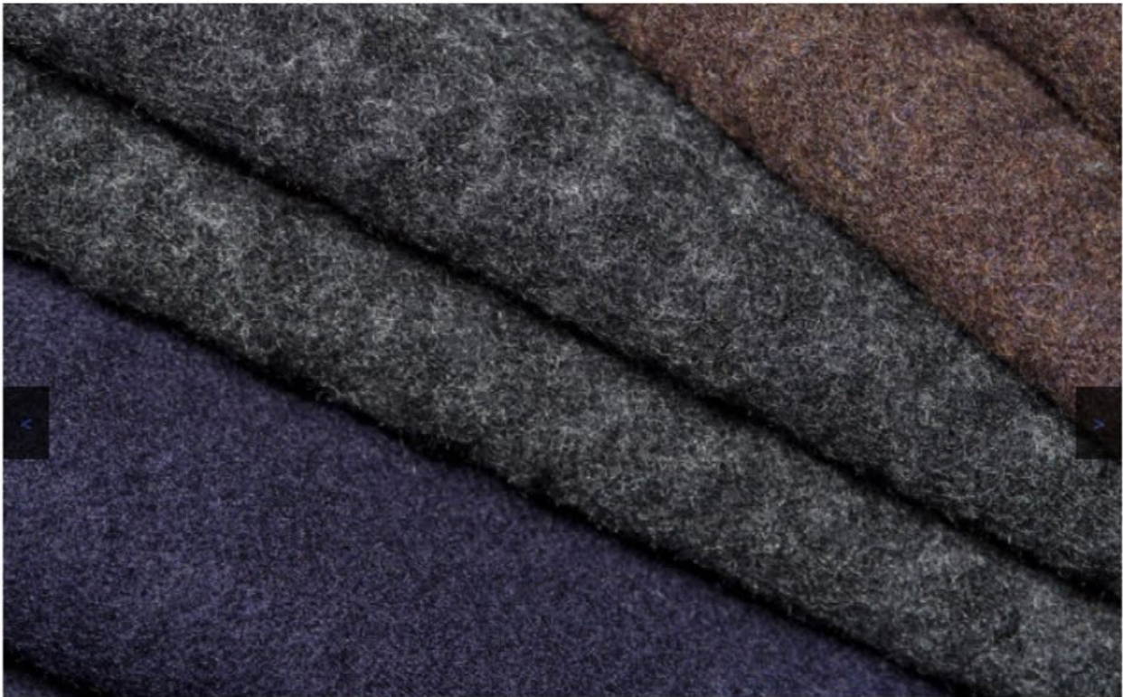
Elastischer Jacquard