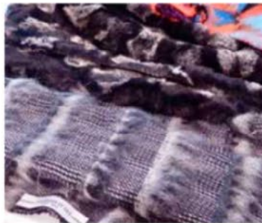
Première Vision Fabrics, J.Tournier

Coat fabrics are even more extravagant in oversized weaves, big wool textures and stripes and fringes, such as at J. Tournier , created with big yarns, giant dogtooth in bouclés, or decorated with bouclé, fringes and trims, such as at Manteco . Felted effects also feature in wools and noble fibres, which might also be needle punched.