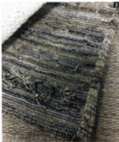
1. Il tema del cinema, che accompagna le fiere di Pitti Immagine, torna anche a Pitti Filati 2. Il filato Giuseppe di Baruffa, in lana e lino 3. Superfici mosse e arricciate per lafil 4. Il rendering dello Spazio Ricerca 5. Atena di Boto Potala: una miscchia di seta, cashmere e lino