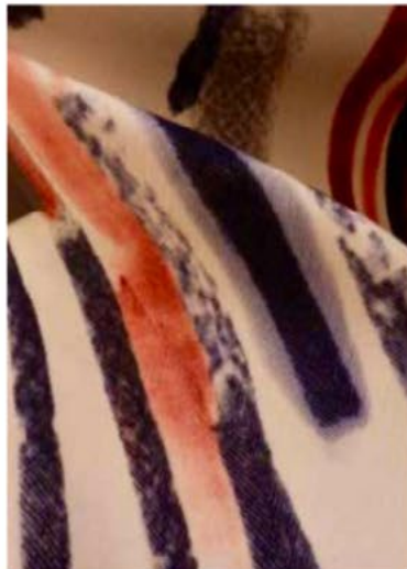
Milano Unica, Ratti

Conscious of sustainability issues, Ratti is introducing more eco-responsible fabrics and finishes - such as Greenel biodegradable and recyclable cellulosic and lyocell fabrics, as well as Newlife recycled polyester and regenerated nylons recovered from waste from fishing nets and swimsuit fabric – all used as print bases. Production processes are being rethought to enable the production of recyclable fabrics and PFC-free finishes.