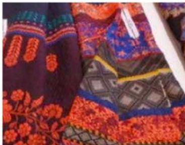
Première Vision Fabrics

But wools are also both dense and fluid as well as being light and springy. Mens suitings are crossing into womenswear, such as classic Prince-of-Wales checks, which might be given treatment overprinted in splashy graphics or splattered with bleach. Tartans are popular with many mills reintroducing variations, including electric colour highlights of electric blue and acid green, which were being snapped up. Ethnic inspired patterns and details in jacquards and wovens are Tibetan inspired or, from the other side of the world, inspired by the patterns of South American Indians from Bolivia and Peru. Fluo colours brighten the colour palette of natural colours.