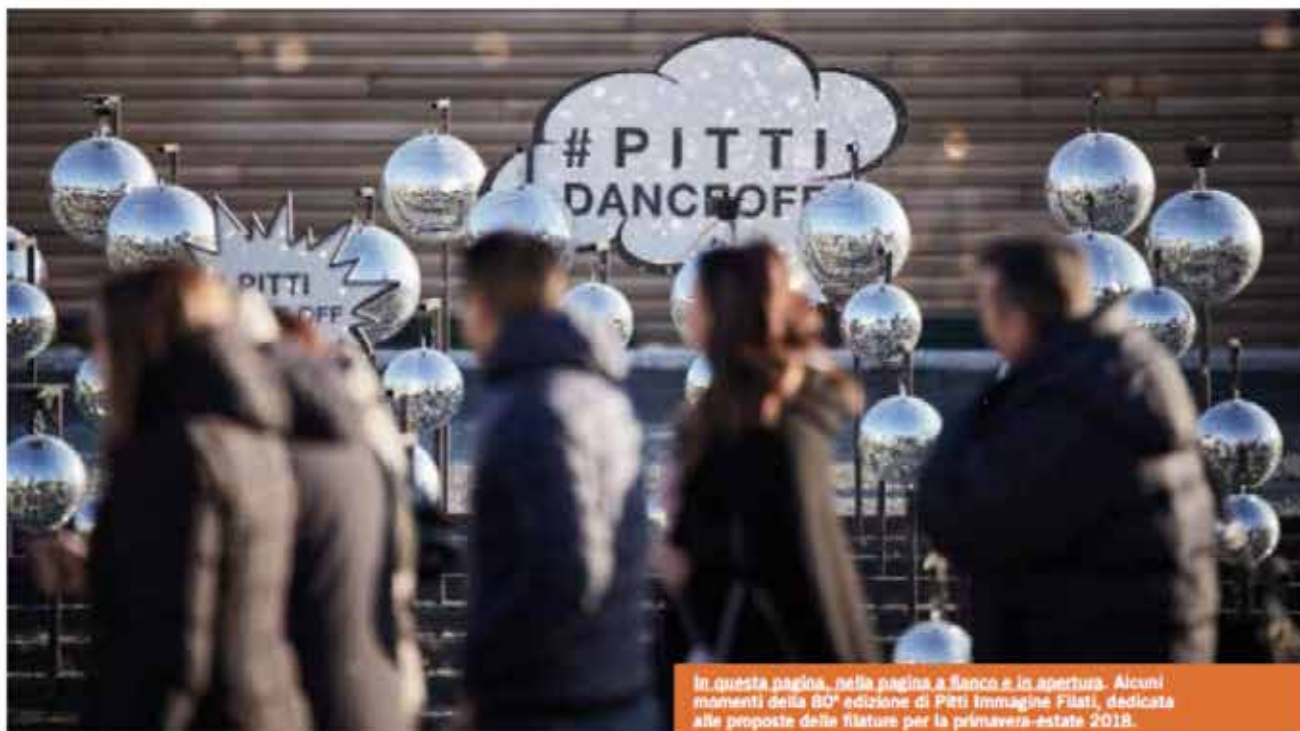
In questa pagina, nella pagina a fianco e in apertura. Alcuni momenti della 80ª edizione di Pitti Immagine Filati, dedicata alle proposte delle filature per la primavera-estate 2018.

Gli spazi della Fortezza da Basso di Firenze hanno accolto ancora una volta l'appuntamento invernale con il salone Pitti Filati , in un'edizione di grande fermento conclusasi all'insegna dell'ottimismo. Oltre 4.350 buyer di tutto il mondo hanno affollato gli stand in cerca di novità e nuove tendenze, apprezzando la qualità e il savoir-faire che le migliori filature sanno esprimere. Rispetto a un anno fa, l'affluenza finale ha registrato un aumento del +3,5% dei compratori italiani, mentre sono cresciuti dell'1% quelli internazionali, superando le 1.800 presenze.