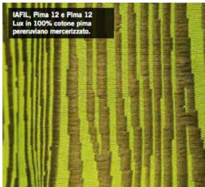
IAFIL, Pima 12 e Pima 12 Lux in 100% cotone pima peruviano mercerizzato.