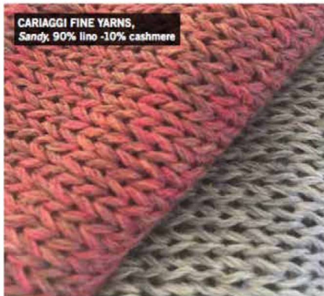
CARIAGGI FINE YARNS, Sandy, 90% lino -10% cashmere

Il microcosmo delle api e dei loro alveari ispirano la nuova collezione della filatura bresciana, con filati che sembrano intrisi di pollini; fresche garze; mercerizzati scolpiti; bagliori metallici per capi tecnici, eleganti e femminili; bouclé dal