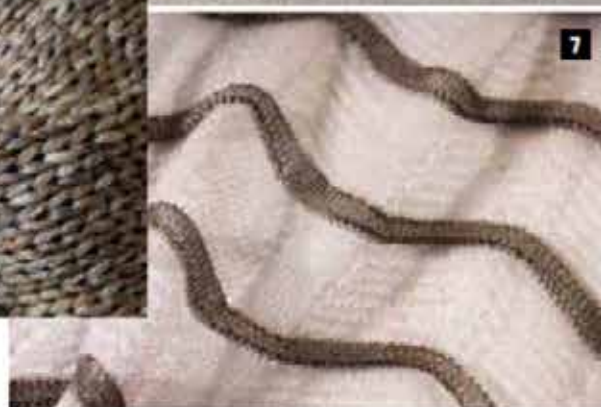
1. BOTTO GIUSEPPE, 100% Seta selvaggia Tussah 2. DUTTO PUNCA, Oregon 100% SE 3. BIELLA YARN, Brozza 60% lana merino - 40% SE 4. FILATURA DI POLLONE, Dalla 93% SE - 7% Lurex