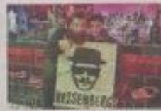
A Grosseto Heisenberg Room Via Cristoforo Colombo 9

Room mi sono immaginato qualcosa di simile alla scatola del gatto di Schrödinger, ma per esseri umani. Il riferimento era invece, più pop che scientifico, e rimandava al chimico della serie Tv nel fatto che qui non solo si miscolano cocktail con perizia da laboratorio, ma si arriva addirittura a quelli molecolari