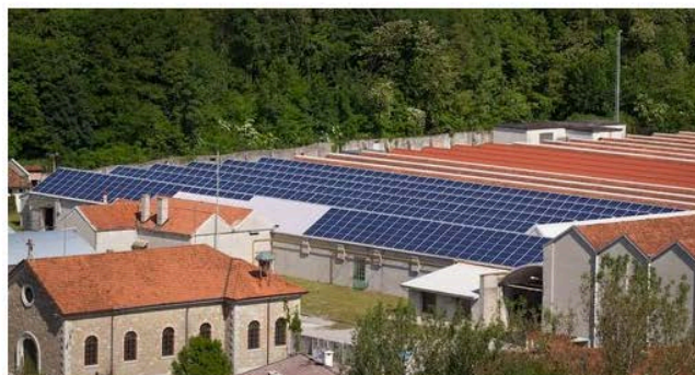
Lo stabilimento di Tarcento

Il nuovo sito www.bottogiuseppe.com presenta un nuovo look, moderno e intuitivo. Suddiviso in sezioni, la forza delle immagini rende accessibile la complessa realtà produttiva dell'azienda la cui produzione si suddivide in filati, tessuti e jersey. L'obiettivo del restyling esprime il desiderio di comunicare con il mercato in modo più veloce e dinamico.