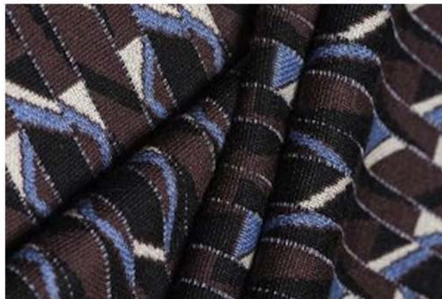
Botto Giuseppe, tessuto Slowool, 100% Lana Merino Superfine, 130's Mulesing

Dopo l'esperienza dell'anno scorso, in cui grazie alla collaborazione del marchio americano Maiyet ha sviluppato un filato “Fair” di alta qualità, sostenibile e certificato 'Cradle to Cradle' di livello Silver e in processo di arrivare a livello Gold, quest'anno è la lana la protagonista delle proposte del brand piemontese, declinata in proposte e titoli diversi: Slowool 2/58 o 2/80; Slowool light 2/48 2/30; Fairwool 2/30 e 2/48, Fair cashmere 2/28 e 2/48.